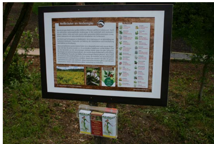
Abbildung 6 Schautafel am NaturErlebnisPfad Magstadt

Schoenenberger unterstützt bereits seit 2012 den NaturErlebnisPfad Magstadt, der von der lokalen Agenda 21 errichtet wurde. Auf dem abwechslungsreichen Weg durch den Wald können Kinder und Erwachsene die Natur mit allen Sinnen erleben und viel Wissenswertes erfahren. Ein Teil des Lehrpfades bietet zudem einen Einblick in die heimische Kräuterwelt. Schoenenberger hat hier verschiedenste Heilkräuter beschildert. Dadurch soll bei den Besuchern das Interesse für heimische Kräuter geweckt werden. Ziel ist, die Bevölkerung der Region für Naturschutz zu begeistern, indem man die biologische Vielfalt und deren Nutzen erlebbar macht. Denn: nur wer die natürliche Vielfalt kennt, schätzt und schützt sie.