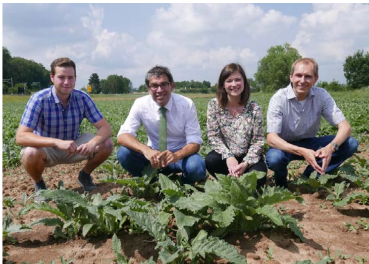
Abbildung 4 Rundfahrt zum Bio-Heilkräuteranbau im Heckengäu