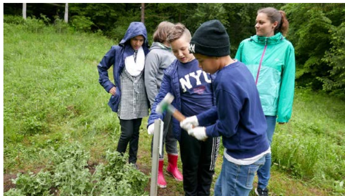
Abbildung 8 Schüler beim Aufstellen der Schilder