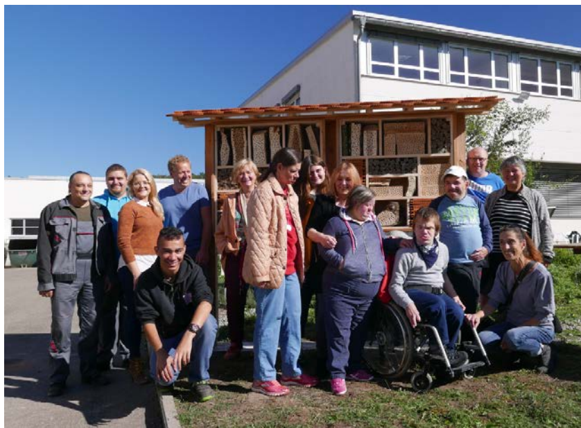
Abbildung 3 Bau eines Wildbienenhauses mit der GWW

Zusätzlich laufen verschiedene Projekte, um das Firmengelände noch biodiversitätsfreundlicher zu gestalten und die Mitarbeiter für das Thema zu sensibilisieren. Im vergangenen Jahr wurde beispielsweise in Zusammenarbeit mit den Gemeinnützigen Werkstätten und Wohnstätten (GWW) ein Wildbienenhaus errichtet. Außerdem wurde ein neuer Blühstreifen angelegt und Bäume gepflanzt. Auch 2019 soll eine weitere Fläche mit Unterstützung des NABU BW noch naturnäher gestaltet werden.