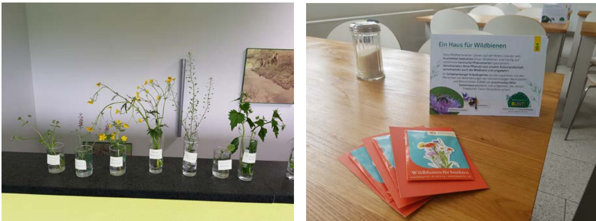
Abbildung 2 Aktionswoche Biodiversität in der Kantine

Zusätzlich laufen verschiedene Projekte, um das Firmengelände noch biodiversitätsfreundlicher zu gestalten und die Mitarbeiter für das Thema zu sensibilisieren. Im vergangenen Jahr wurde beispielsweise in Zusammenarbeit mit den Gemeinnützigen Werkstätten und Wohnstätten (GWW) ein Wildbienenhaus errichtet. Außerdem wurde ein neuer Blühstreifen angelegt und Bäume gepflanzt. Auch 2019 soll eine weitere Fläche mit Unterstützung des NABU BW noch naturnäher gestaltet werden.